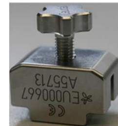
Limiteur pour écarteur postérieur X1 Ref : EU000667