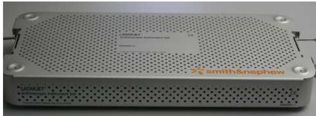
Boîte de stérilisation Ref EU000736 Couvercle Ref EU000737