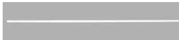
X3 ELITE Switching Stick Ref 3801