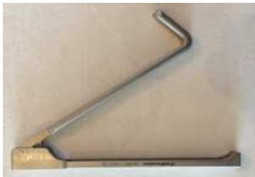
Tire-broche Ref : EU000734