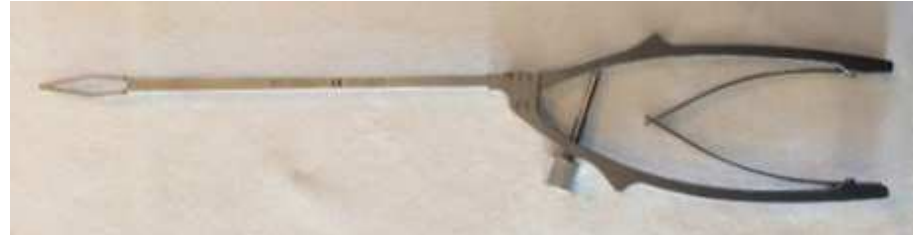
Ecarteur à souscapulaire X2 Ref : EU000647