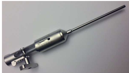
Tenseur à fil Ref : E000690