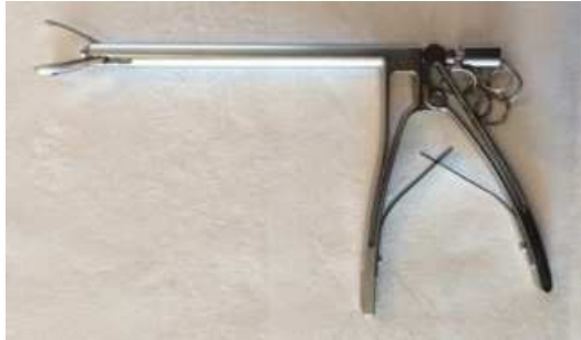
Guide coracoïde dite "pince à sucre" Ref : EU000645