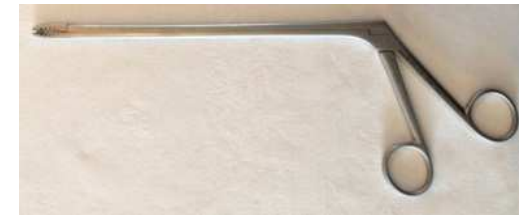
Pince à coracoïde Ref: 75102285 ( PN2321)