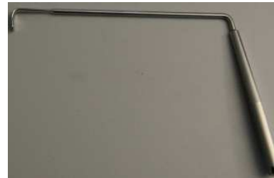
Ecarteur à nerf ✓ Droit Ref: EU000624 ✓ Courbe Ref : EU000623